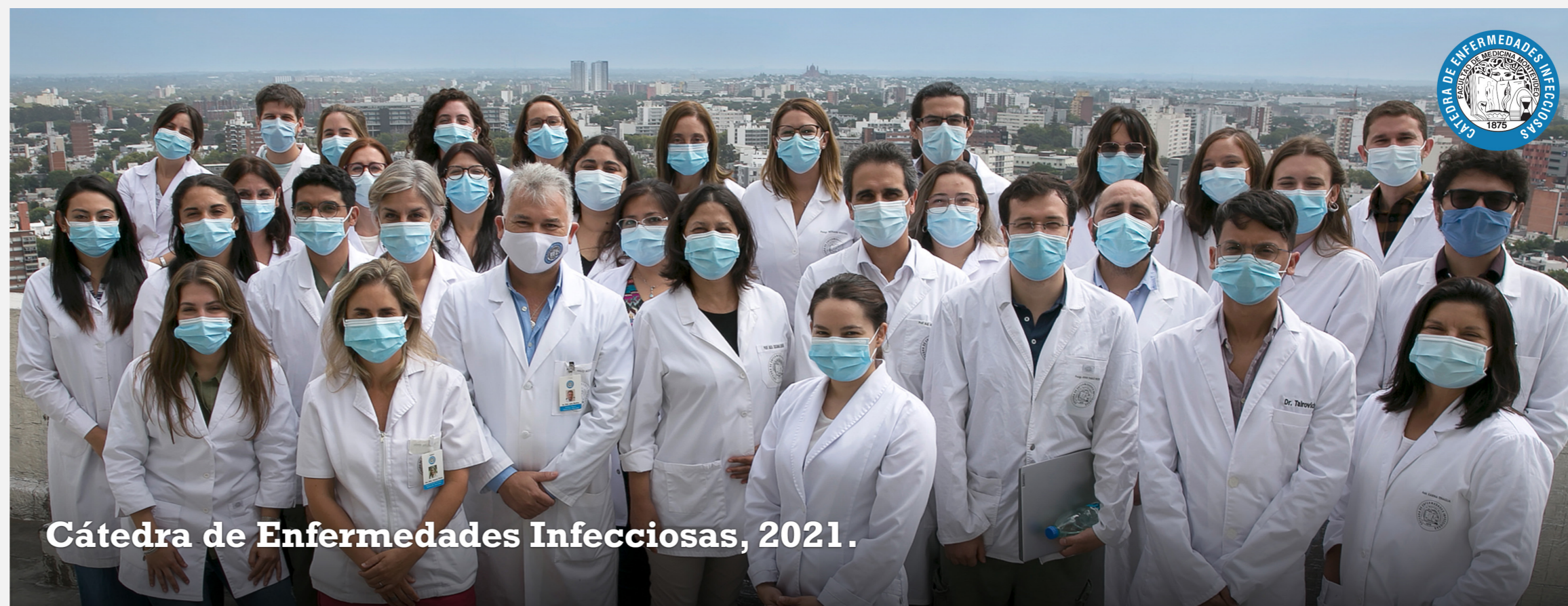
Cátedra de Enfermedades Infecciosas, 2021.

10 puntos sobre profilaxis post-exposición sexual al VIH Uruguay 2022 2ª Versión